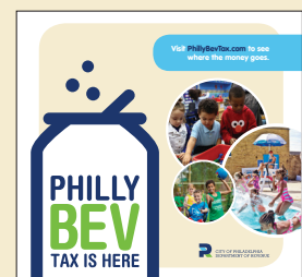
Adhesivo para ventana