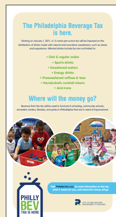
Tập Thông tin Xé được